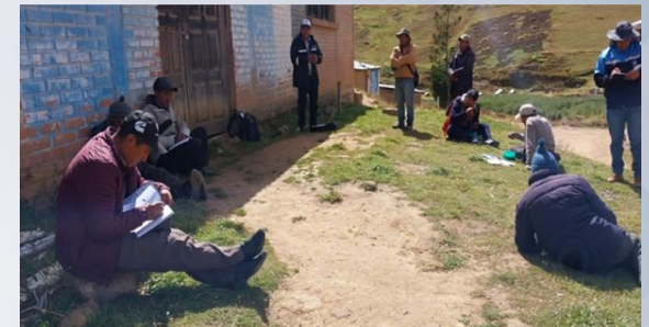
Taller de capacitación prevención de a Eventos Adversos (sequía, Helada, granizada)