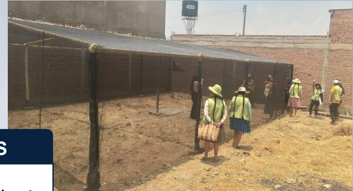
Entrega de malla semisombra y cuyes reproductores a productores APAHFAC.

4 asociaciones con fortalecimiento para producción agropecuario en el marco del convenio YACHAY CHHALAKU.