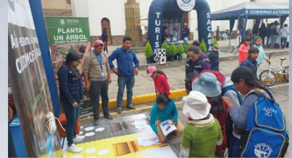
“Día del Peatón”