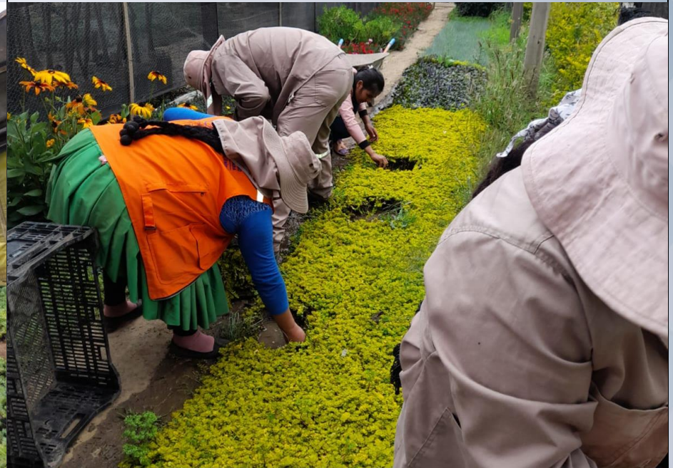
PRODUCCIÓN DE PLANTINES ORNAMENTALES