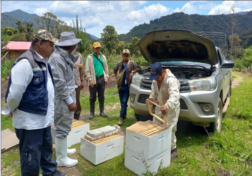
ENTREGA DE COLMENAS

Auditoría financiera externa al proyecto Mej. Prod. de Leche Mediante Crianza de Ganado Lechero Raza Holstein y Pardo Suizo en Distritos Lava Lava y Aguirre.