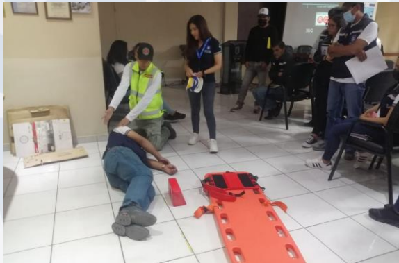
Taller de capacitación en Primero Auxilios (Servidores Públicos)

258 servidores públicos con conocimiento en prevención y atención a Emergencias y/o Desastres.