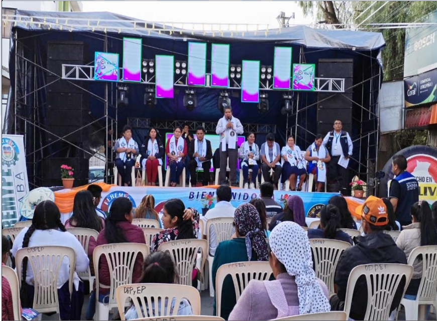
FERIA EXPO MYPES SACABA

14 Ferias productivas agropecuarias beneficiando a 650 Unidades Productivas