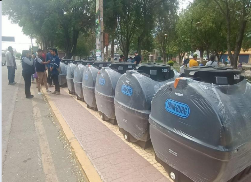
ENTREGA DE TANQUES

Se realizó la entrega de 4.000 alevines de trucha para la siembra en lagunas comunales en el Distrito Rural de Palca, con la Gobernación.