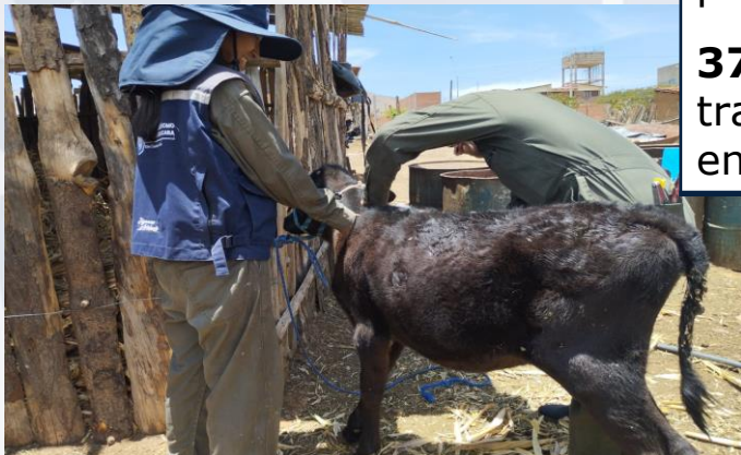
Campaña de vacunación contra brucelosis bovina

37.085 animales con tratamiento preventivo contra enfermedades.