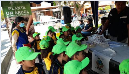
“Día del Árbol”