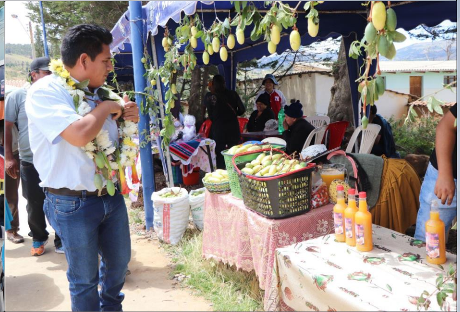
FERIA DEL TUMBO Y SUS DERIVADOS