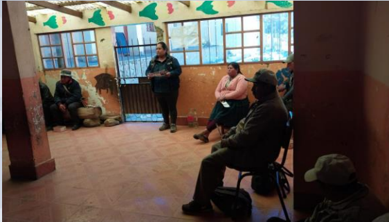
Taller de capacitación prevención de Incendios Forestales