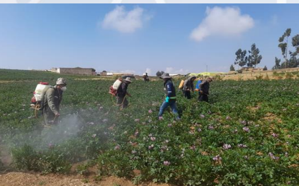
Capacitación en manejo y control de plagas y enfermedades en cultivos