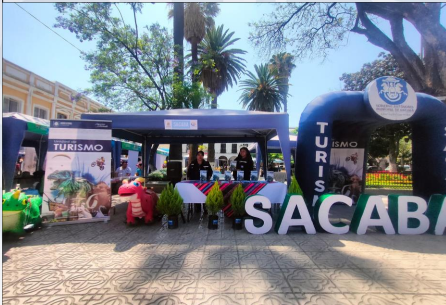
PROMOCIÓN DE ÁREAS TURÍSTICAS DEL MUNICIPIO

3 eventos de deportes extremos de promoción de zonas turísticas logrando 300 personas participantes.