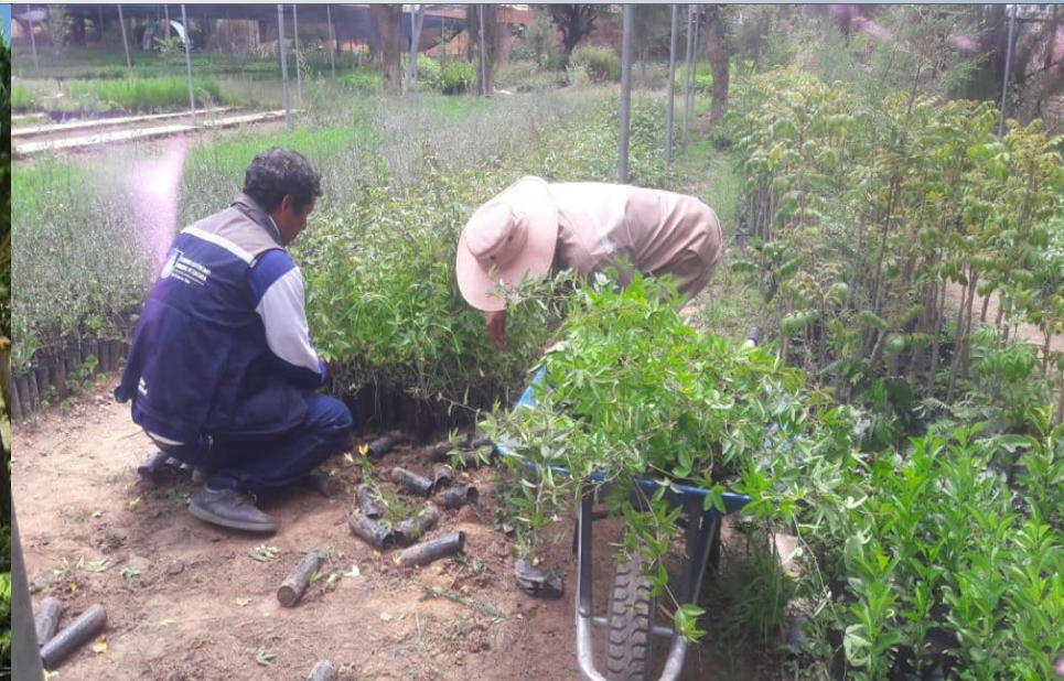
PRODUCCIÓN DE PLANTINES FRUTALES