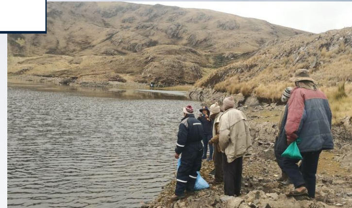
Entrega de 20.000 ovas embrionadas de trucha a productores ASOPPAK.