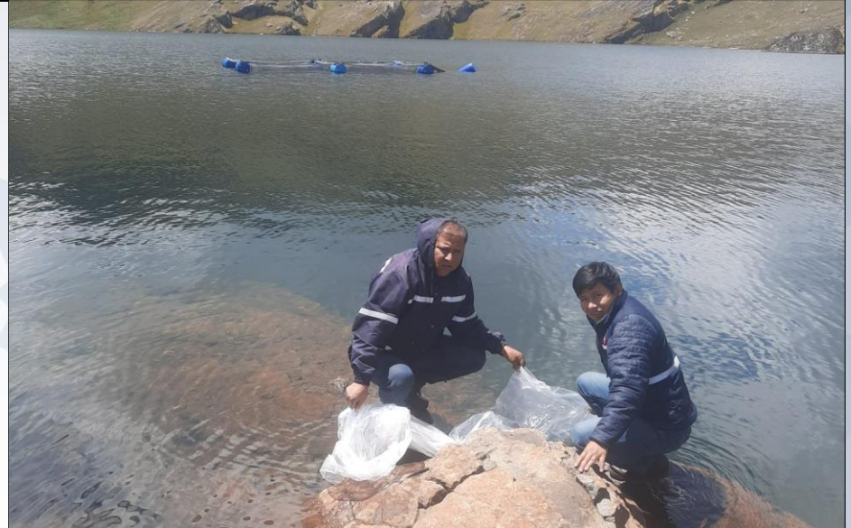
SIEMBRA DE ALEVINES