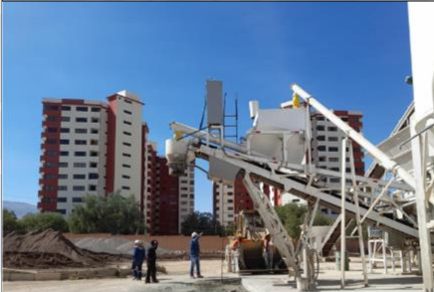
INSPECCIÓN INDUSTRIA PARA EMISIÓN DE RAI

Seguimiento e inspecciones técnicas a 120 Unidades Industriales Categoría III y IV para verificar el cumplimiento de la normativa ambiental vigente.