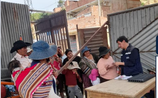
Capacitación en Producción de hortalizas en huertos familiares