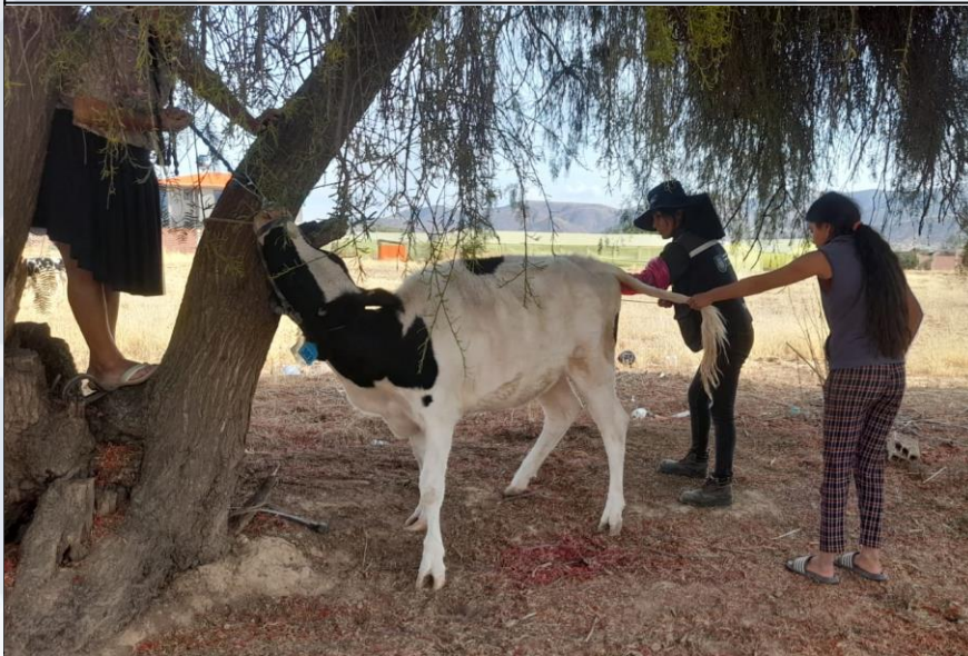
CAPACITACIONES EN HIDROPONÍA

30 familias de productores beneficiados con la compra de semilla de papa.