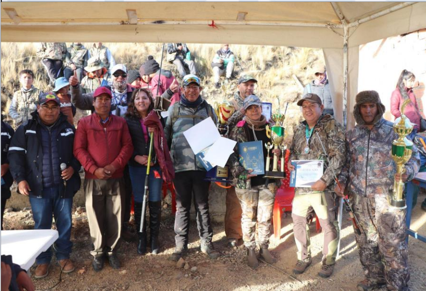
PREMIACIÓN PESCA DEPORTIVA