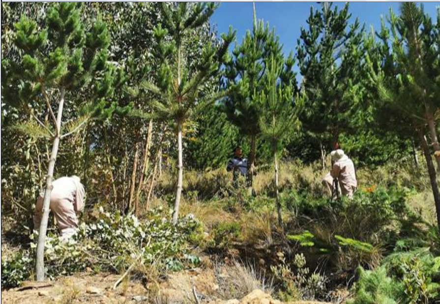
ASISTENCIA TÉCNICA EN MANEJO DE BOSQUES

18.925 plantines frutales producidos con técnicas de injerto, para fomentar el establecimiento de plantaciones con fines de producción de frutales.