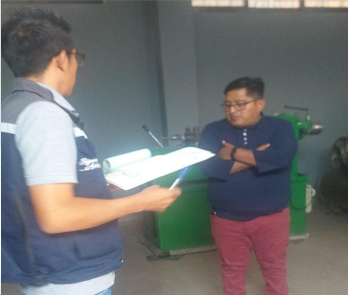
CONTROL Y FISCALIZACIÓN DE UNA ACTIVIDAD

Atención continua y oportuna sobre de 63 denuncias de Actividades, Obras y Proyectos (AOP) en el municipio de Sacaba, durante la gestión 2023