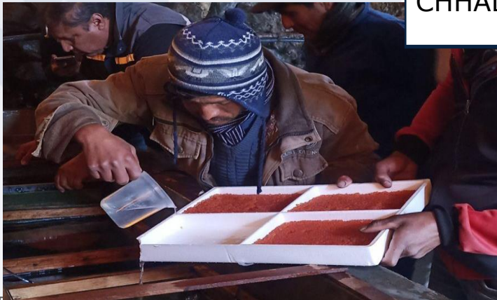
Entrega de 20.000 ovas embrionadas de trucha a productores piscícolas de Malaga .