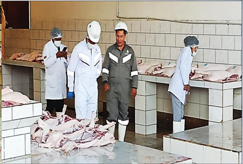
INSPECCIÓN DE CARNE PORCINA