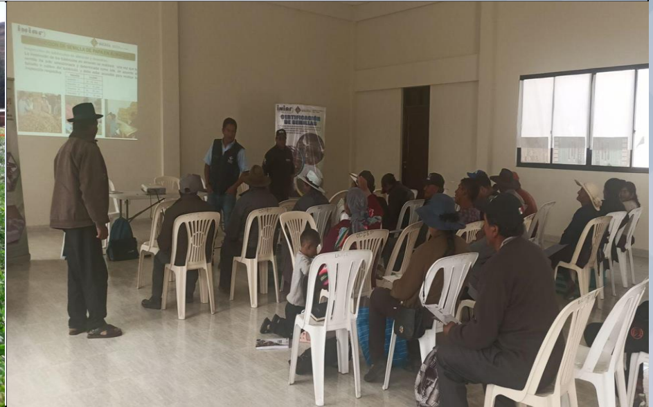
CAPACITACIÓN PRODUCCIÓN DE SEMILLA DE PAPA