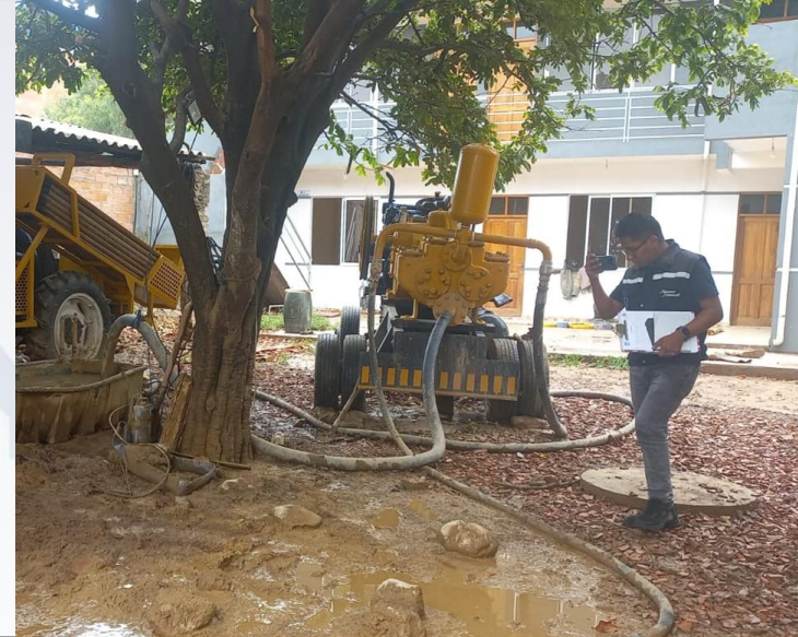
INSPECCIÓN POR DENUNCIA