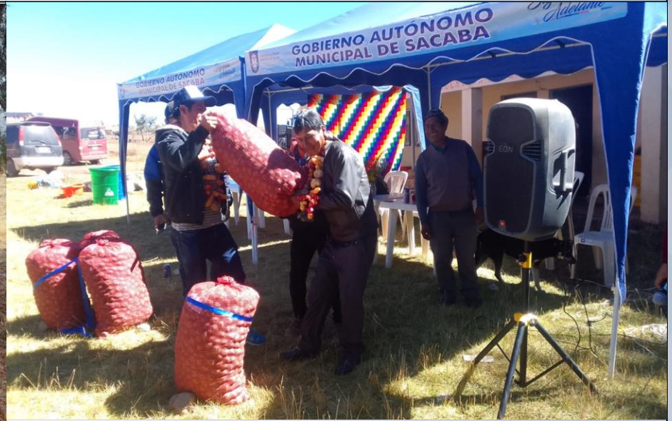
ENTREGA DE SEMILLA DE PAPA