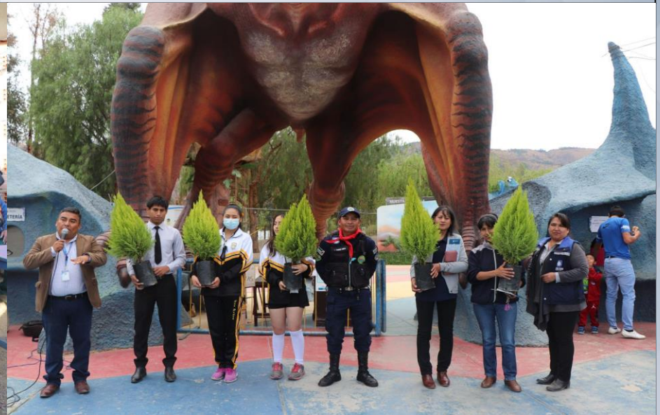
PROMOCIÓN DEL PARQUE PREHISTÓRICO