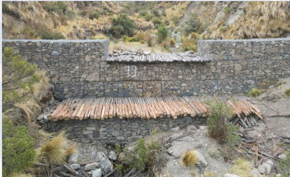
Mantenimiento de platea antisocavante (Chungara)