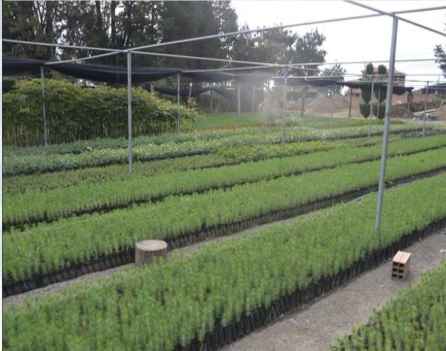
PRODUCCIÓN DE PLANTINES

147.09 Ha de plantaciones forestales en los diferentes Distritos del Municipio de Sacaba.