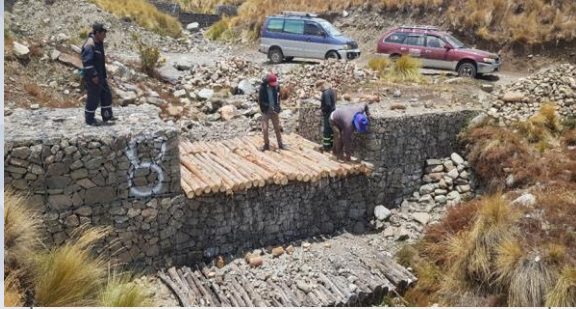
Mantenimiento de vertedero (Wara Wara)