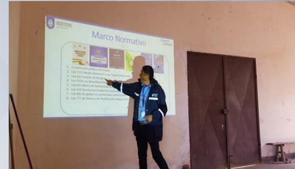
Taller de capacitación prevención de a Eventos Adversos (sequía, Helada, granizada)

12 talleres de capacitación en prevención y atención. 140 comunarios con conocimiento en prevención y atención de eventos adversos.