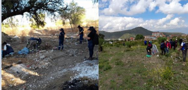
"Primera Campaña de Limpieza en AP Metropolitano"