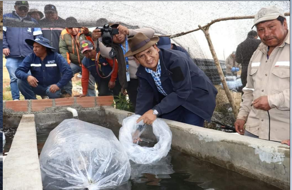
SIEMBRA DE ALEVINES DE TRUCHA