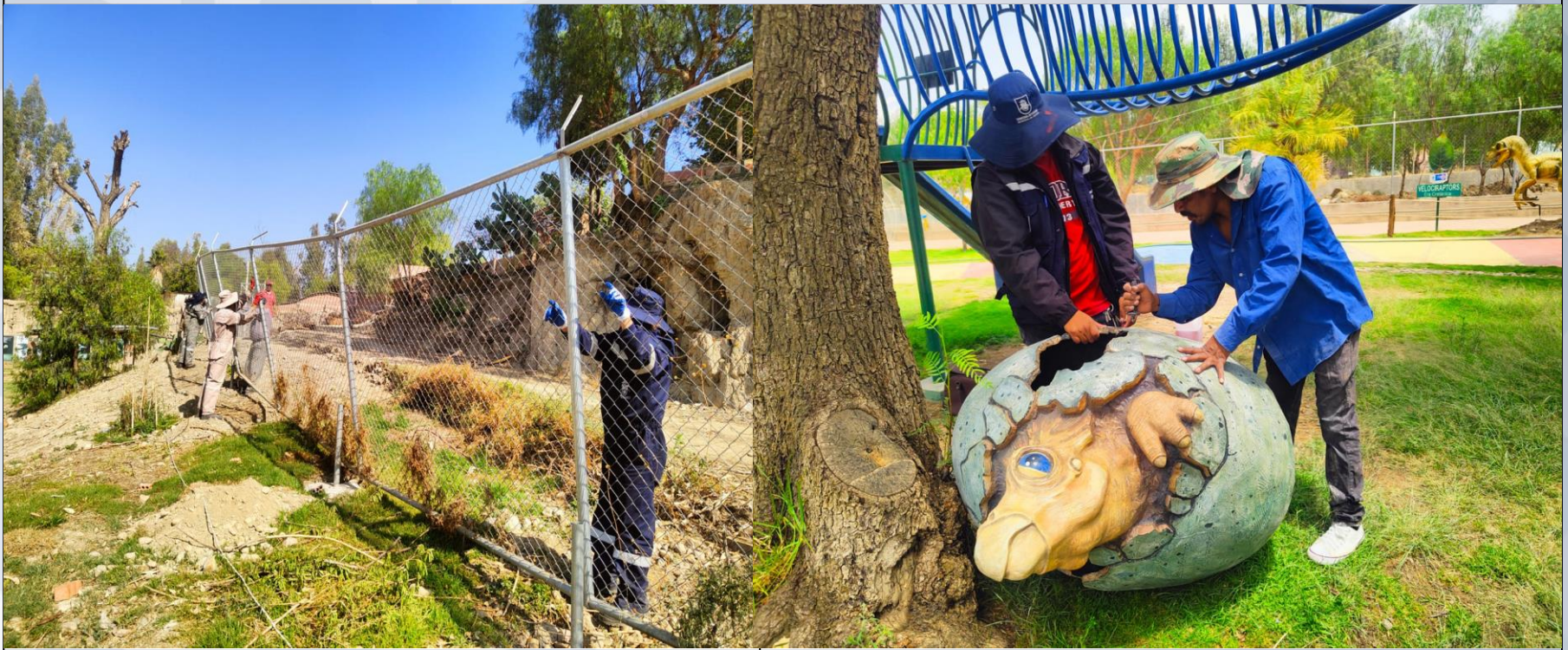
MANTENIMIENTO DE LA MALLA PERIMETRAL

2 mantenimientos del parque prehistórico.