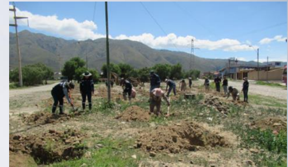
"2da Campaña de reforestación en AP Metropolitano"