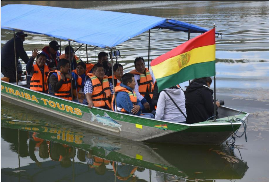
FESTIVAL DE SAN ISIDRO

5 Promociones del parque prehistórico, con unidades educativas del nivel primario y secundario.