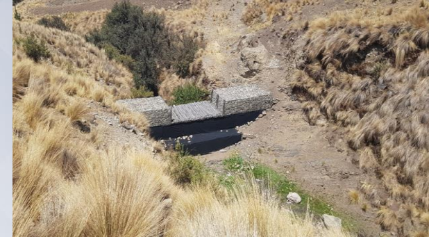
Reemplazo de Geotextil (Chungara)