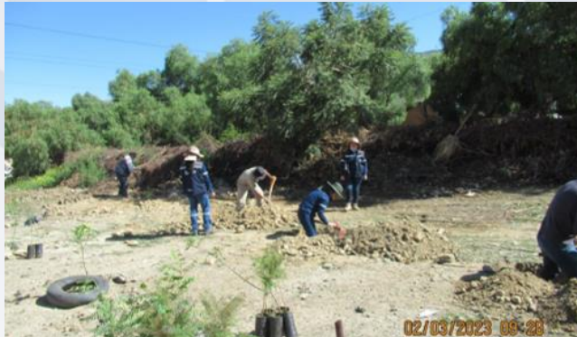
"1ra Campaña de reforestación en AP Metropolitano"