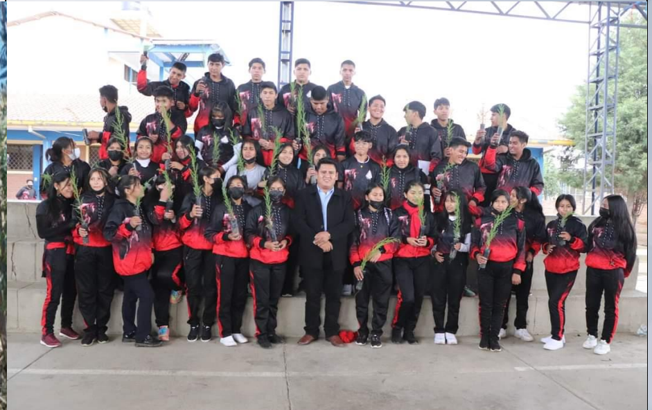
FORESTACION CON UNIDADES EDUCATIVAS