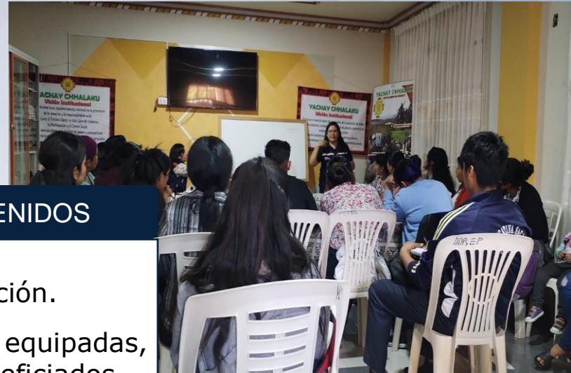
Capacitación para realizar transacciones del comercio electrónico.

10 asociaciones equipadas, beneficiando a 736 beneficiados.