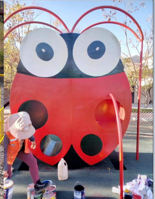
MANTENIMIENTO PARQUES RECREATIVOS