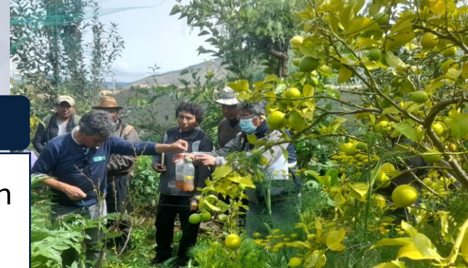
Capacitación en producción agroecológica de alimentos