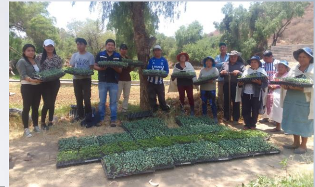
Capacitación en producción de plantines de hortalizas