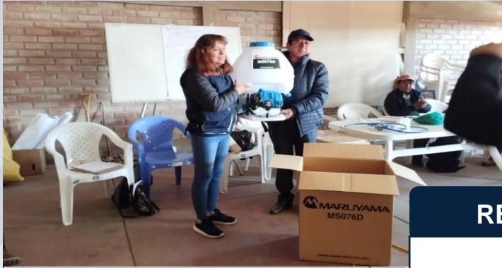
Entrega de motofumigadora y bi-insumos a productores de APPAS.