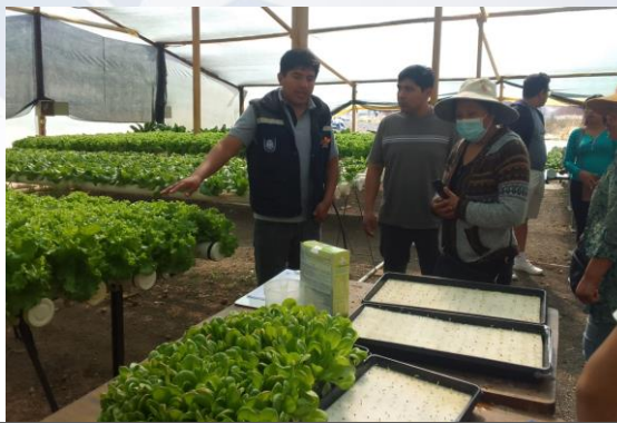
Capacitación en producción de hortalizas de hoja en sistema hidropónico