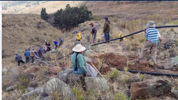
Equipamiento para la producción agropecuaria