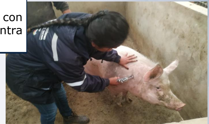
Campaña de vacunación contra la peste porcina