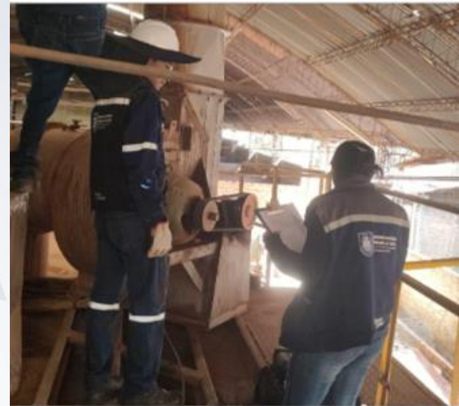
VERIFICACIÓN DE CUMPLIMIENTO DE LA NORMATIVA AMBIENTAL