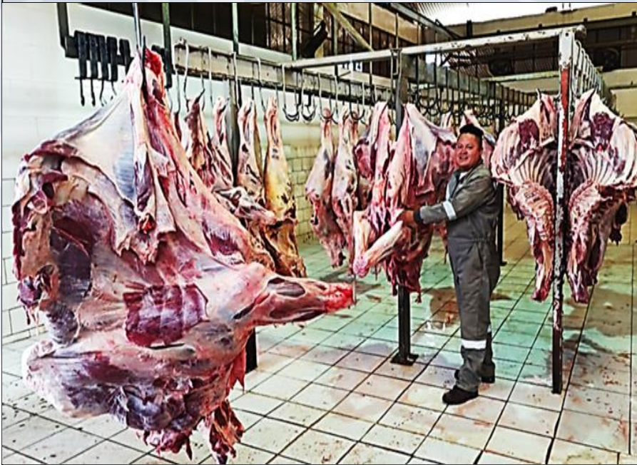
INSPECCIÓN DE CARNE DE BOVINOS

10.793 cabezas de ganado Porcino faenadas en condiciones de inocuidad alimentaria exigidas por las normas del SENASAG.