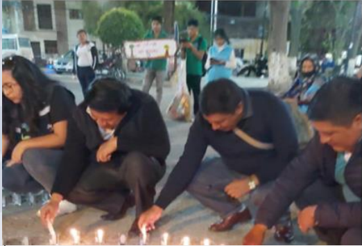
“Hora del Planeta”