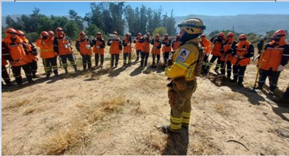
Taller de capacitación en atención de incendios forestales (servidores públicos)