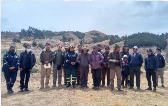
Taller de capacitación atención de Incendios Forestales (comunidades)