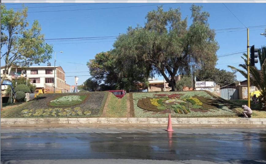
ESCUDOS ROTONDA PESCADITOS