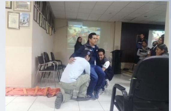
Taller de capacitación en Evacuación (Servidores Públicos)