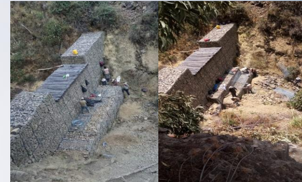
Mantenimiento de Gaviones dañados por el desgaste (Sapanani)