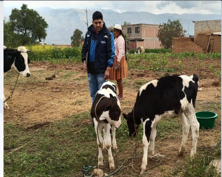
INSPECCIÓN PARA AUDITORÍA PROYECTO GANADO LECHERO