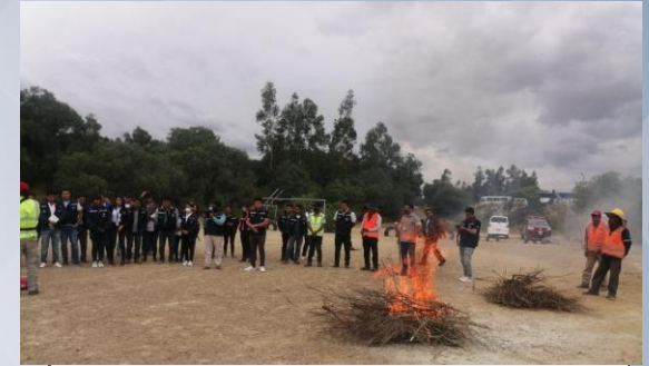
Taller de capacitación Manejo de Extintores (Servidores Públicos)