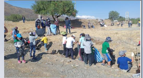
" Segunda Campaña de Limpieza en AP Metropolitano"

5 Campañas de reforestación y 2 campañas de limpieza en el Área Protegida Metropolitano Arocagua.