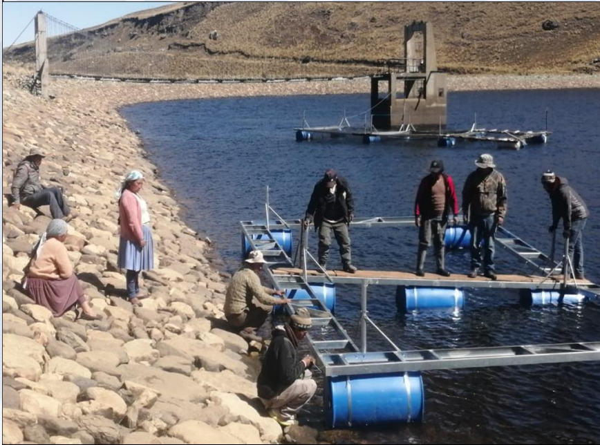
INSTALACIÓN DE JAULA FLOTANTE

17 siembras de alevines de trucha arcoiris, beneficiando a 400 familias.