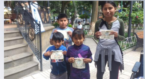
“Día del Medio Ambiente”