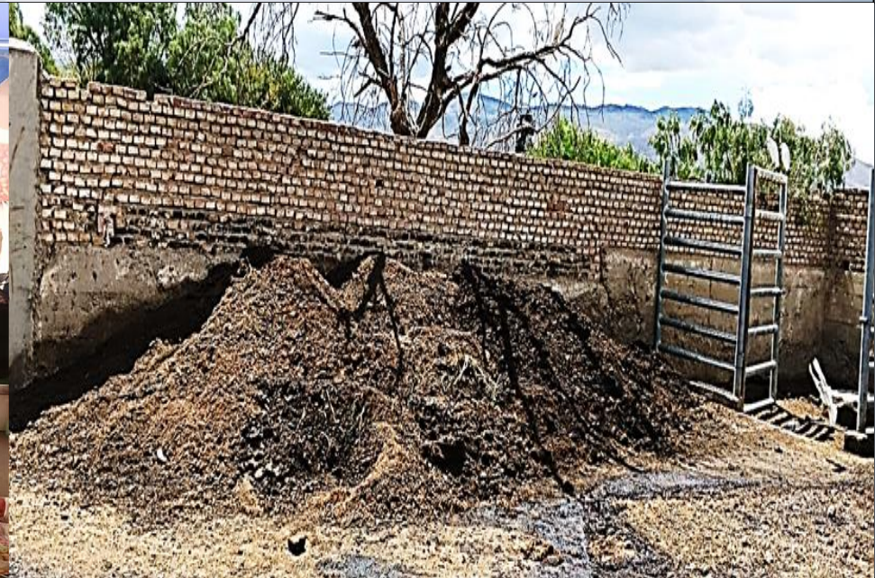
PROCESADO DE GUANO