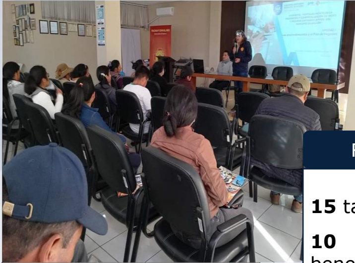
Capacitación en estandarización de productos.