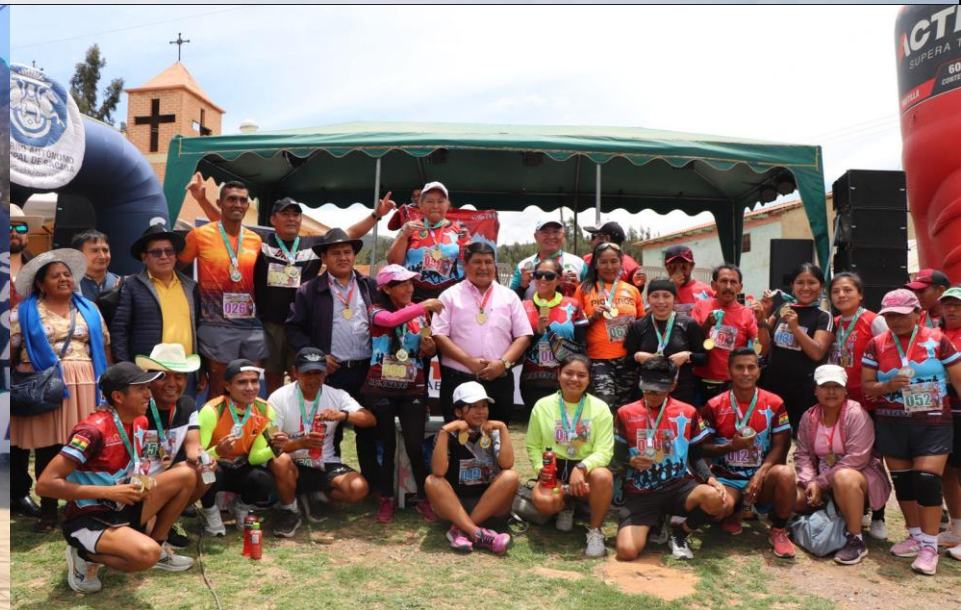
PREMIACIÓN CARRERA PEDESTRE UCUCHI