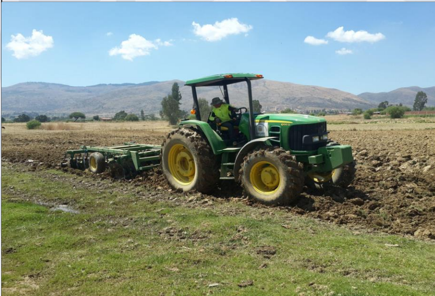
SERVICIO DE MAQUINARIA AGRÍCOLA

2 implementos adquiridos para maquinaria agrícola, beneficiando a La Central Regional Challviri del D.R. Palca