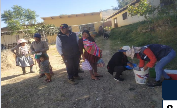
Campaña de vacunación contra la newcastle