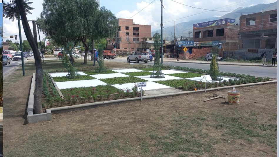
TABLERO DE AJEDREZ