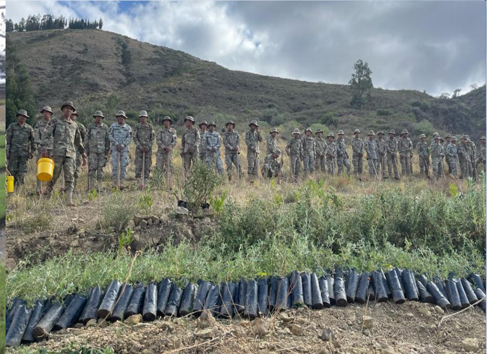
REFORESTACIÓN CON APOYO DE MILITARES