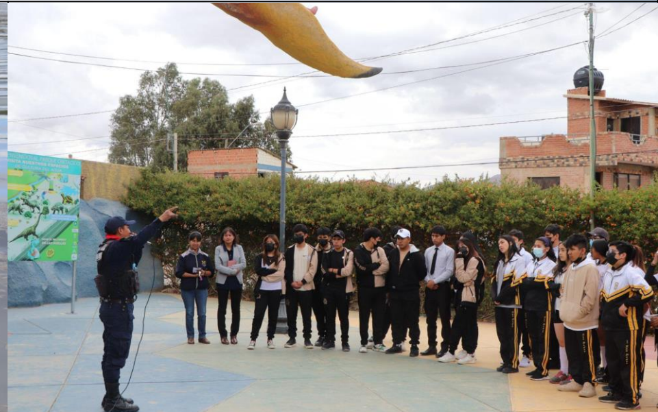
PROMOCIÓN PARQUE PREHISTÓRICO