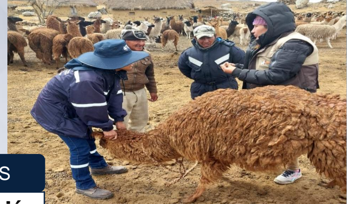
Campaña de vacunación de desparasitación y vitaminización