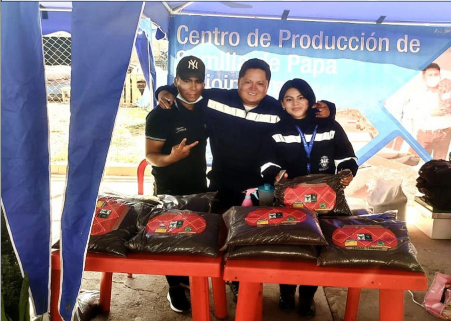
PROMOCIÓN DE LA HARINA DE SANGRE

180.000 kilogramos de guano disponible como INSUMO de producción de SUSTRATO.